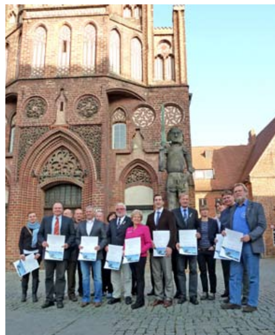
Gründung des Organisationskomitees für die Ruder-EM

Ich denke schon, dass sich Einiges im Rudersport verändert hat. Wenn man sich z.B. die Entwicklung der Fahrzeiten anschaut, ist es alles deutlich schneller geworden. Die Bestzeit ist heutzutage über 25 Sekunden schneller, als unsere Fahrzeit damals war. Das ist