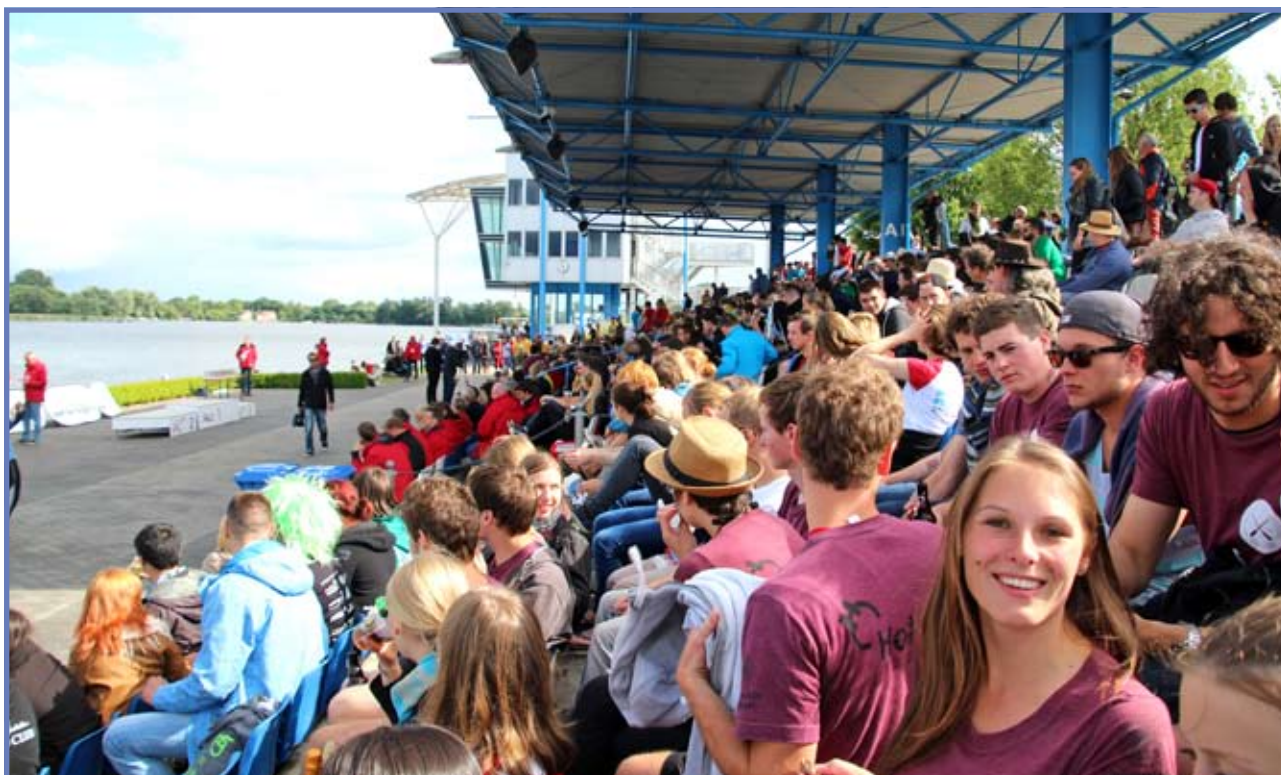
Die Regattastrecke „Beetzsee ist für volle Tribünen und tolle Stimmung bekannt, wie hier bei der 15. Deutschen Betonkanu-Regatta. / The regatta course of Beetzsee is known for providing full house and a great atmosphere as seen here during the 15th German concrete canoe regatta