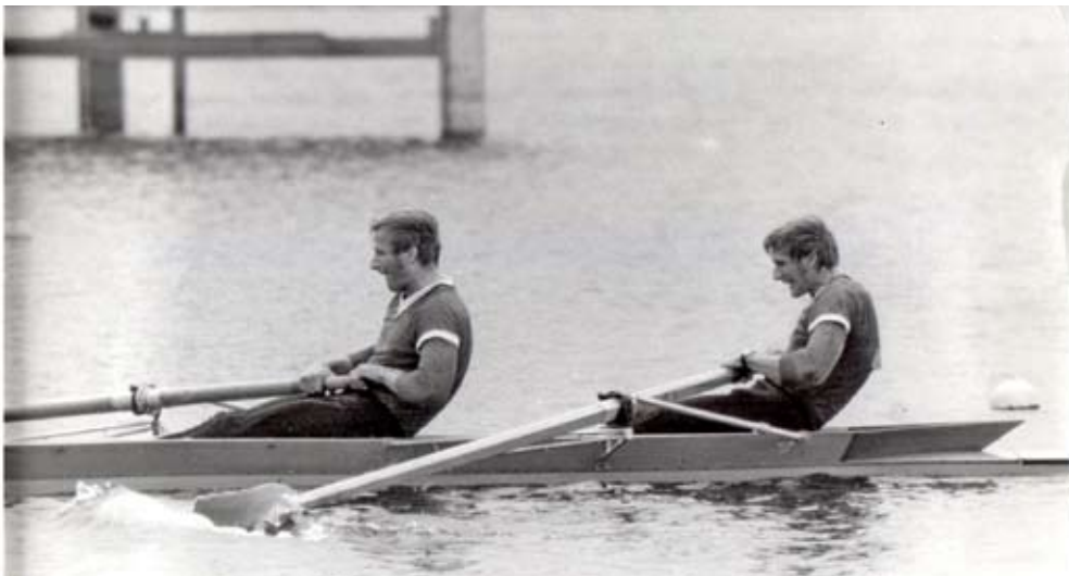
Die Olympiasieger und Weltmeister Bernd und Jörg Landvoigt am 21.07.1979 bei den DDR-Meisterschaften im Rudern, Regattastrecke auf dem Beetzsee

Ich wünsche mir, dass die Regattastrecke in Brandenburg an der Havel weiterhin auch als Austragungsort für internationale Meisterschaften genutzt wird. So eine hervorragende Wettkampfstätte, wie die Regattastrecke „Beetzsee“, ist für die Stadt und das Land Brandenburg nicht nur in sportlicher Hinsicht, sondern auch unter touristischen und wirtschaftlichen Aspekten, enorm wichtig.